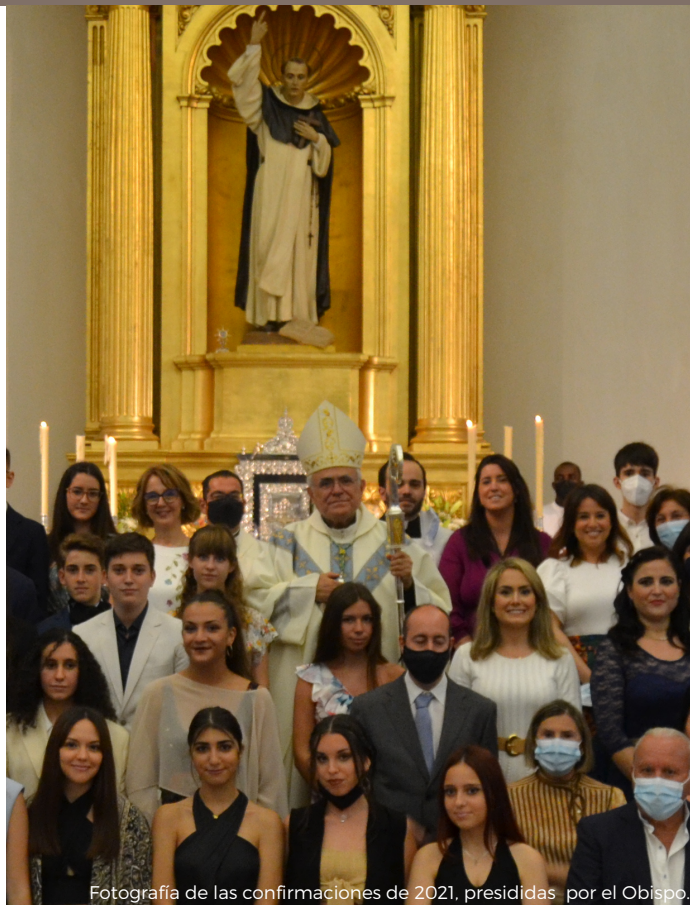
Fotografía de las confirmaciones de 2021, presididas por el Obispo.

Todavía no se conoce la fecha concreta pero en el inicio del año 2023 el Obispo tiene prevista esta visita. Aunque don Demetrio ha visitado con asiduidad la parroquia, ahora se trata de un acercamiento bastante singular pues desea conocer a fondo cómo vivimos la fe en esta comunidad parroquial de Cañero y Fidiana.