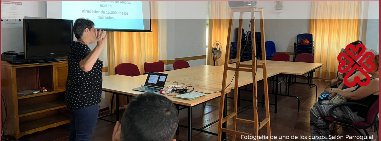
Fotografía de uno de los cursos. Salón Parroquial.

Desde Cáritas "San Vicente Ferrer" se mira por las familias con situaciones más difíciles y el objetivo primordial es la promoción. Por ello, este año se han iniciado una serie de cursos y talleres que han favorecido entre otras cosas la inserción en el mercado laboral.