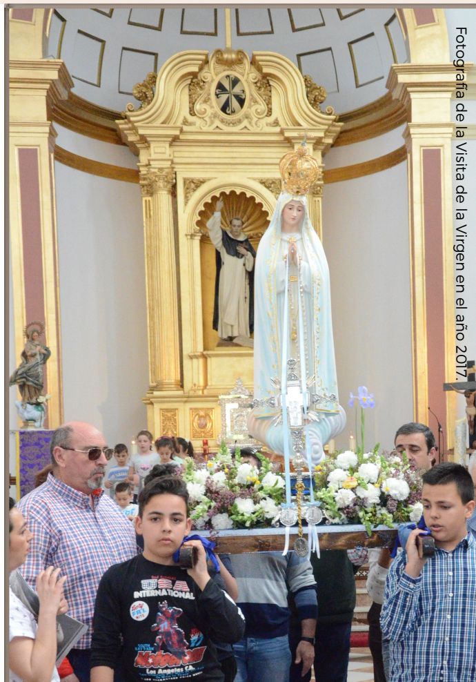
Fotografía de la Visita de la Virgen en el año 2017.

La imagen fue regalada por San Pablo VI a España en 1967 con motivo del 50 aniversario de las revelaciones de Fátima.